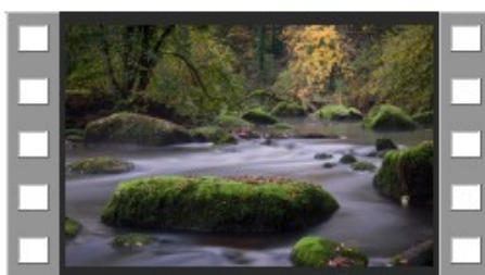
Diapo mvt eau.mp4

Nous avons visionné le fil rouge « l'eau en mouvement », diaporama réalisé par David Brette